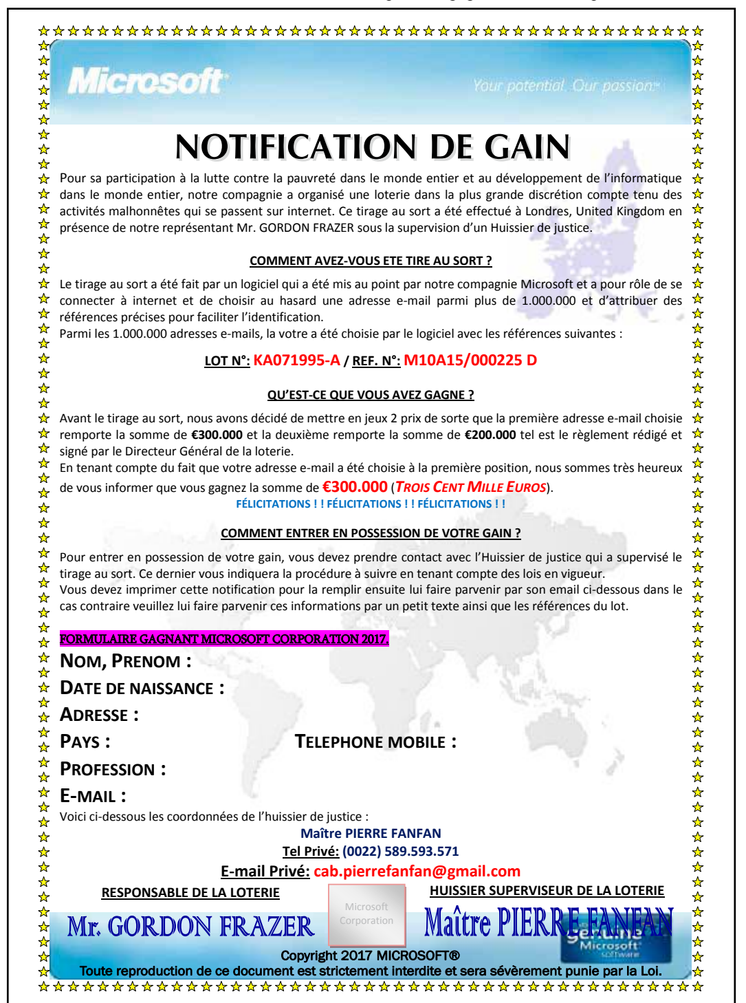
Illustration 2, la pièce jointe au courriel reçu

Dans le doute, ignorez complètement ce genre de courrier. Vous auriez plus de chance de gagner à la loterie nationale ou européenne que de gagner réellement en répondant à ce genre de courrier, qu'il soit papier ou électronique.