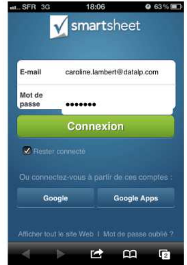
Exemple d'accès à partir d'un smartphone

Projet, Processus, Tâches, Ventes, Opérations Tout ce que vous gérez déjà, gérez-le depuis Smartsheet